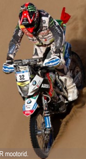
Soome tipp mootori tehnikute ehitatud on kõik BMW 450RR mootorid.