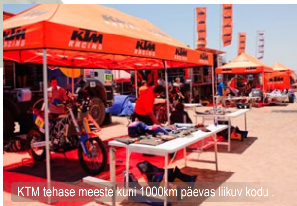
KTM tehase meeste kuni 1000km päevas liikuv kodu.