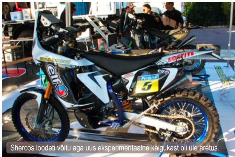
Shercos loodeti võitu aga uus eksperimentaalne käigukast oli üle aretus.

varem või hiljem lendab nii mootor ka ilmselt laiali. Teatud tüüpi kõva kõrbeliiv käitub aga nagu kuulaager ja on nii libe nagu kruusatee. Seega on kõrbeliivas vajalik enamasti eriline sõidutehnika, mis on kõva, rally kontra ja liivara sega. Lisaks on vaja eripärast tunnetust nii mootorile, kui eelkõige pinnasele ja silma lugemaks loodust - mis tuleb vaid aastatega. Kõrbeliiv võib olla ka nii pehme, et hullu kaasitamisega kaod koha peal otse maa alla lihtsalt, sest mx kummid veavad sind alla mitte edasi tihti peale hoopis. Samas kohas viibides peaaegu mitte kunagi ei kohta sa ka samasuguseid tingimusi. Kõrb on üks väga muutuv omamoodi materjal. Meekärg liiva sektorites saad aga edasi kiiremini slicki, kui mx kummiga. Seega väga peen meelitamine ja väga puhta joonega poisid pead olema erinevalt Euroopa liivas sõitmisest kuhu tihti võib sisse rammida ja peal hoida kuis tuju ja rõõmu on. Pole harvad juhused kus võib avastada väga kõva liiva mees, et tal ei tule mitte midagi kõrbe liivas välja. Lihtsalt ei tule ja ainult käpuli ja liiva all nagu vees. Enamasti aga küll mõne aja möödudes hakkab tulema kui loodust loed ja ei võitle sellega - kiiresti sõitmine düünides on aga täiesti teine ooper, mis jõukohane navigeerimisega koos vaid üksikutele maailmas. Summa sumaarum on aga Lõuna-Ameerikas kõvemaid düüne rohkem kui Aafrikas. Aafrikas on peaaegu ainult pehmed asjad peale Merzugat Ameerikas on aga kõike ja on ka päris kõvasid mürakaid suure teraga. Mis läbi ka kõrgused on