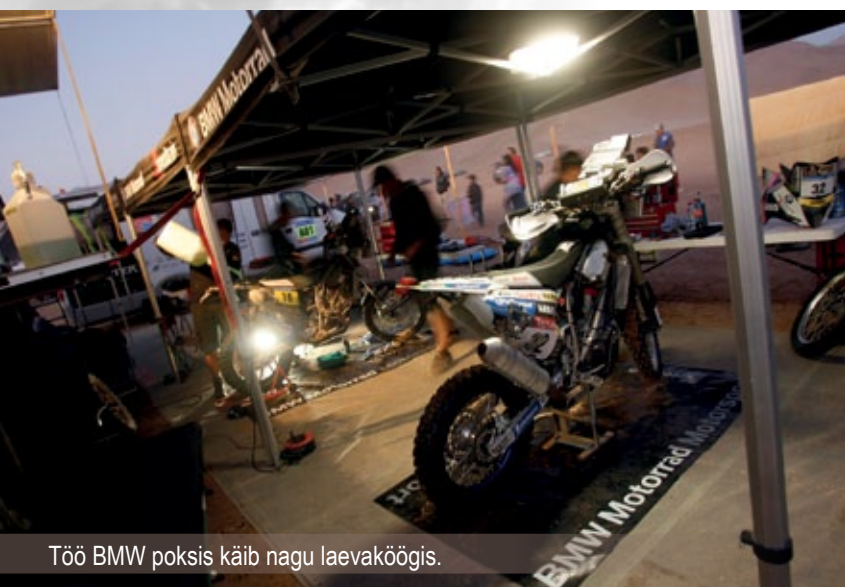
Töö BMW poksib käib nagu laevaköögis.

Privaterist rootslane Ronnie Bodinger, Rootsi enduro MV võrrimees sõitis tänase etapi lõpuni ühe käega. Mees kukkus 6 etapil ja vigastas oma