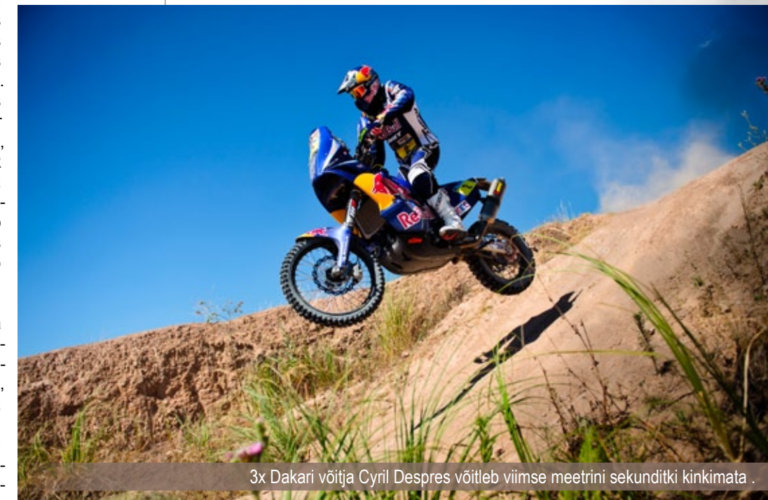
3x Dakari võitja Cyril Despres võitleb viimse meetrini sekunditki kinkimata.