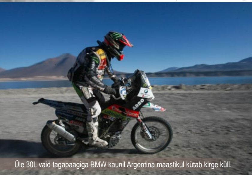
Üle 30L vaid tagapaagiga BMW kaunil Argentina maastikul kütab kirge küll.

vaid püsti püses ja kõige vähem vigu tehes. Miks Coma täna Comat saab teha on see, et Cyril tegi oma saatusliku 10min vea kinnastega. Väiksed detailid maksimaalne tähelepanelikus pisimatele detailide mängib selles mängus peakangelast alati. Ajamata habe, kiivri rihm, valed sokid, kehva prilli svam, 2mm vale leiksu bend võib määrata kõik ühel hetkel, kui sa pead probleemi taluma kümneid või sadu tunde hiljem. Dakar on eelkõige