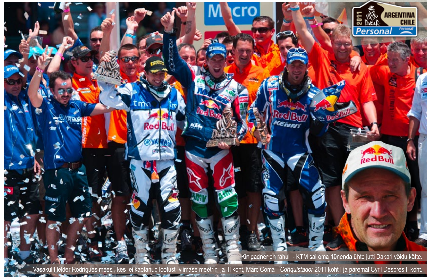
Kinigadner on rahul - KTM sai oma 10nenda ühte jutti Dakari võidu kätte.