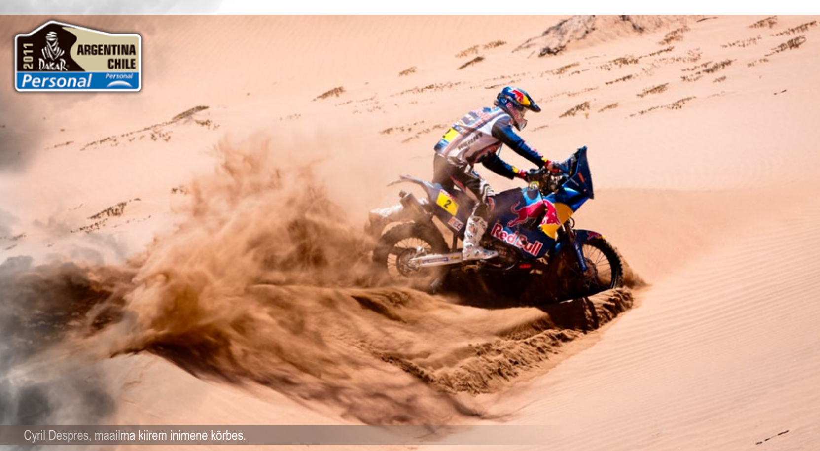
Cyril Despres, maailma kiirem inimene kõrbes.

pille on ka varem olnud rajal Aafrikas ja sealgi edukalt. Pikk ülesõit võidusõidu alguses ilma kiiruskatseteta oli hea sisseelamise päev kõigile, sõitjatest kuni teenindava personalini, kelle koormused ja kohustused on sõitjatele sarnaselt täiesti ebamaised. Seega oli võistluse algus väga mõistlikult ja targalt seatud, et kehad harjuksid eesolevate enneolematult pikkade päevadega isegi Dakari kohta. Häda oli aga selles, et 377 km-i läbimist mitteetapina lugemisel tekitati meele segadus sõidupäevade ja etapinumbrite vahel. See aasta ei oodanud õnneks sõitjaid Dakari regioonis ees juba tavapärased üleujutused, mis ei tähendanud, et vihm ja muda platsi ilmuda ei võiks ja rekkadel ei peaks olema kaasas survepesurid, mida Aafrikas iial vaja ei läinud.