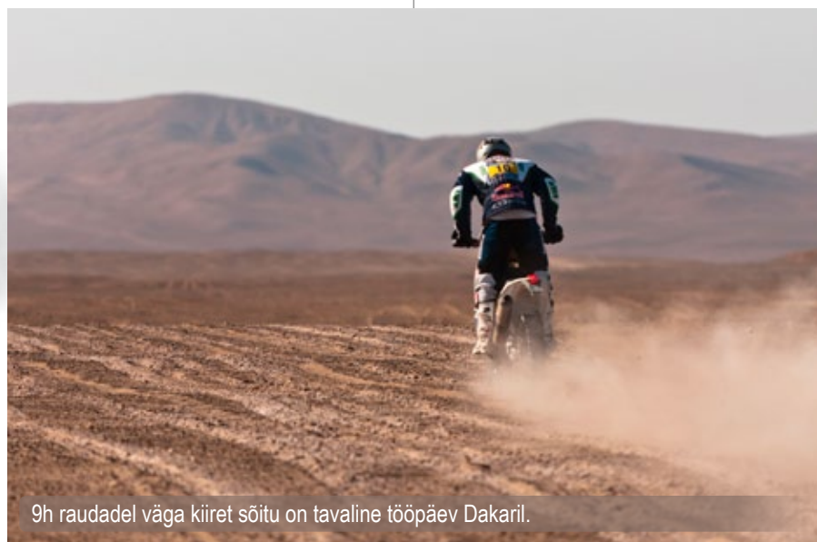
9h raudadel väga kiiret sõitu on tavaline tööpäev Dakaril.

jõuab järg kunagi hiljem, kui toorainet veel siis on aga, kes teab, mis siis maailmas toimub ja, mis kadunud mandril selleks ajaks käib. Brazilia on Hondale kõige olulisemaid olulisemaid turge, KTM avas oma uue maailma suurima KTM super poe seal, mis on Emiraatide ees nüüd suurim KTM pood maailmas. Brazilia on maailma üks olulisemaid päris superriike, mis asutab ka kindlasti varsti Dakari taldrikule. 2012 Dakari näeme me juba Peruu pinnal ning Bolivia ootab. Dakar muutub üha enam eelkõige äriks mitte seikluseks nii nagu Thierry Sabine ta kunagi Libyas motikaga eksides lõi. Et suund on selgelt täna sinna kuhu kõik elujõulised tipp sarjad on liikunud. Ja loogiline ta on ka on, sest tänapäeval ei saa enam lõputult surnud lehma maksta just tootjad. Võidu sõidetakse ikka selleks, et müüa mootorrattaid mitte millegi muu pärast. Liitigi kui kõige maksumus on kümnekordistu-